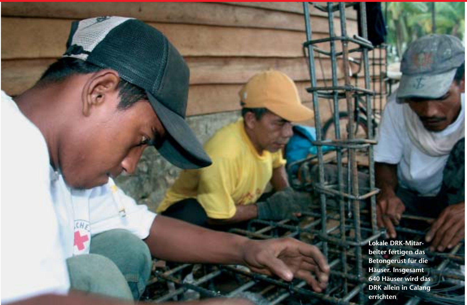
Lokale DRK-Mitarbeiter fertigen das Betongerüst für die Häuser. Insgesamt 640 Häuser wird das DRK allein in Calang errichten

werden, das letzte in zweieinhalb Jahren. Die Komplexität dieses Projekts können sich Außenstehende nur schwer vorstellen. Nach einer gründlichen Erhebung, wie viele Menschen eigentlich ein Haus benötigen, wurde ein geeigneter Haustyp gesucht. Das Modell wurde den künftigen Bewohnern bei einer ausführlichen Präsentation in einer Moschee in Calang vorgestellt. Die Menschen konnten Änderungswünsche einbringen und – sogar gegen Bezahlung – an ihrem künftigen Dorf mitbauen. Zur Zeit ist das Musterhaus in Arbeit, an dem die Vorarbeiter geschult werden. So finden die Tsunami-Opfer Beschäftigung – das Rote Kreuz arbeitet „nicht nur an Wänden und Dächern, sondern daran, den Menschen einen Neuanfang zu ermöglichen“, wie es der Rotkreuz-Logistiker Marc-André Souvignier ausdrückt.