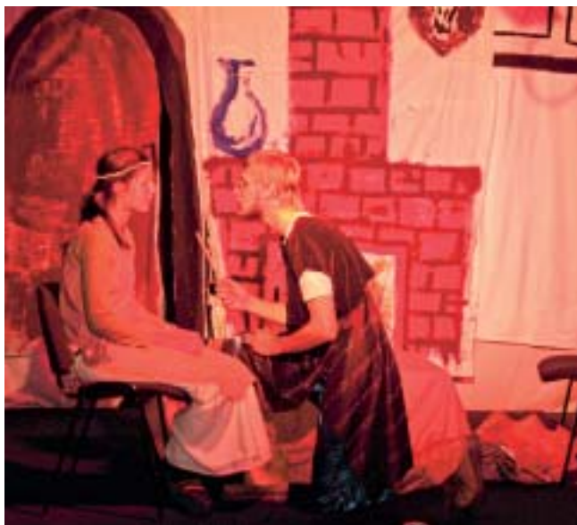
Aschenputtel und Prinz in den selbstgebauten Kulissen