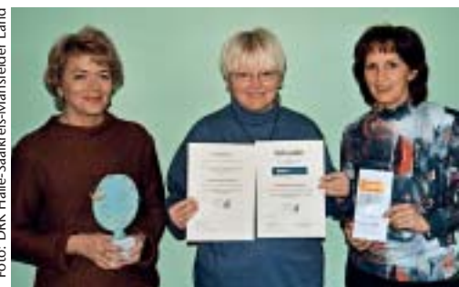
Große Freude über den Preis „Engagiert für Halle“ am Tag des Ehrenamtes