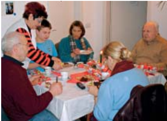
Die Bedürftigen genossen in der Suppenküche ein Weihnachtsmenü und erhielten kleine Geschenke