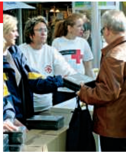
Fast 800 neue Auto-Verbandskästen wurden in Halle ausgegeben

Der Kontakt zu unseren Patienten ist uns ganz wichtig. Wir nehmen uns die Zeit und hören auch ihre Geschichten an; was sie alles erlebt haben oder wenn es ihnen nicht gut geht. Da spürt man, dass sie froh sind, jemandem ihr Herz ausschütten oder auch erfreuliche Nachrichten erzählen zu können. Nicht selten entsteht so ein vertrautes Verhältnis. Der schönste Dank für uns Zivis ist es, wenn wir unseren täglichen Dienst beenden mit der Gewissheit, den Menschen ihre individuellen Wünsche erfüllt zu haben. Ein Dankeschön, ein Händedruck oder ein zufriedenes Lächeln ist für uns die schönste Bestätigung für geleistete Hilfe. Auf alle Fälle empfinden wir den Zivildienst als persönlichen Lebensgewinn. Von ehemaligen Zivis wissen wir, dass ihnen dieser Einsatz neue berufliche Perspektiven eröffnen konnte.