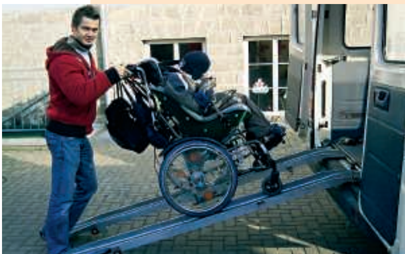
Auffahrrampen für Rollstühle gehören bei den Fahrzeugen des Behindertenfahrdienstes selbstverständlich dazu