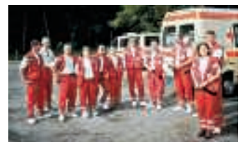
Allzeit bereit, wenn's drauf ankommt: die Magdeburger Helfertruppe

Die vorwiegend jugendlichen Helfer sind gut ausgebildet und nehmen jährlich an Fortbildungen teil. Dies ist notwendig, um die Qualität der Sanitätsabsicherung auch in Zukunft halten zu können. Denn neben den vielen kleinen und mittleren Veranstaltungen sichern die Helfer auch Großveranstaltungen ab, etwa zur Fußball-WM, bei denen Qualität, Zuverlässigkeit und sicheres Auftreten unabdingbar notwendig sind. Ralf Ziegler