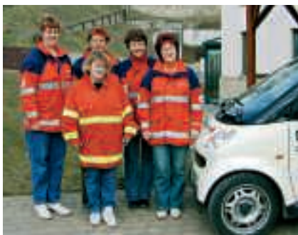
Gute Geister in Rot: die netten Schwestern von der Sozialstation

Betreuung von alten und pflegebedürftigen Menschen in unserem Einzugsbereich. So wurden im Jahr 2005 fast 112 000 Kilometer gefahren, um die Patienten bei 21 700 Hausbesuchen zu betreuen. Die Schwestern der Sozialstation – telefonisch erreichbar unter 03 925/24 81 40 – sind im Landkreis bekannt und beliebt. Sie meistern alle Schwierigkeiten und beweisen immer wieder, wie vieles möglich ist. So organisieren sie jährlich ein Sommer- und Weihnachtsfest gemeinsam mit den Patienten. Ein nettes Wort oder eine kleine Geste während der Betreuung und Pflege ist immer mit dabei – und Tipps für die Angehörigen, wie sie manches besser machen können.