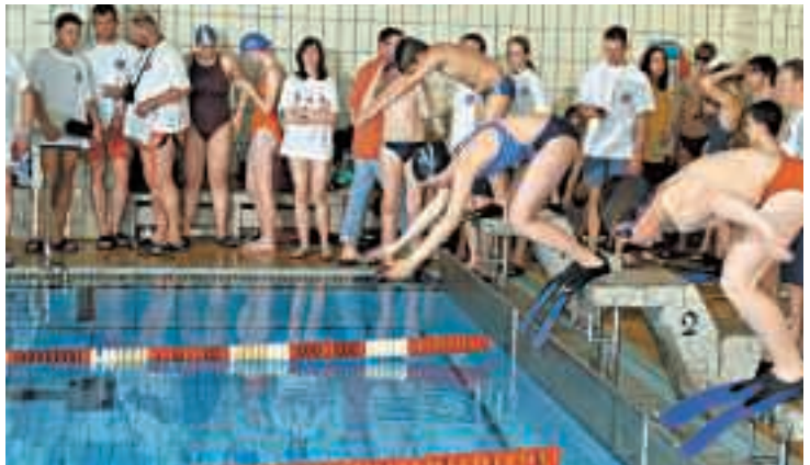
Mit Flossen, mit Kleidern, mit Opfer: In verschiedenen Disziplinen mussten die Rettungsschwimmer ihr Können beweisen