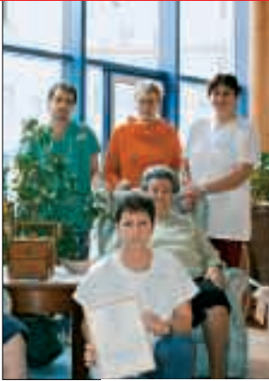
Die Steuerungsgruppe: ein starkes Team zum Wohl der Gäste