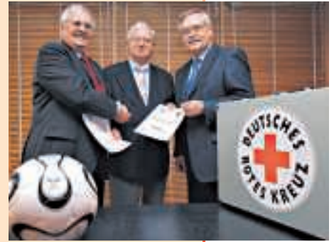
Die Vertragsunterzeichnung für den DRK-Betreuungseinsatz bei der Fußball-Weltmeisterschaft

■ Das DRK wird bei den Spielen der FIFA Fußballweltmeisterschaft 2006 die Notfallmedizinische Versorgung in den Stadien leisten. Bei 64 WM-Spielen werden für Gäste, Zuschauer und Spieler 8395 DRK-Helfer aus DRK-Landes- und Kreisverbänden im Einsatz sein. Auch wenn in Sachsen-Anhalt keine Spiele stattfinden, wird doch das sachsen-anhaltinische Rote Kreuz bei vielen großen Spielübertragungen im Land für den Sanitätsdienst gebraucht werden. Die meisten Helfer sind Ehrenamtliche aus den Bereitschaften.