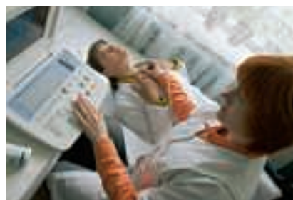
▲ Flächendeckende Untersuchungen helfen beim Kampf gegen Krebs

Strahlende Blaubeeren: Nur mit Gottvertrauen essbar