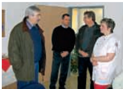
Vorstand und Geschäftsführer des Kreisverbandes gratulierten zum Jubiläum

Mit der Einführung der Pflegeversicherung 1995 wurden manche Prozesse noch komplizierter und es waren wieder viele persönliche Gespräche mit den Patienten notwendig. Aber auch diese Hürde konnte relativ schnell überwunden werden.