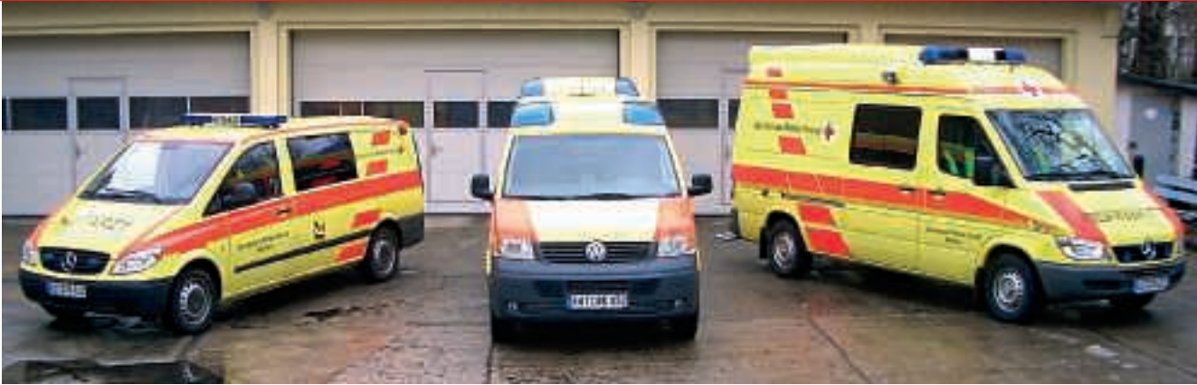
Leuchtend schwefelgelb, machen die neuen Rettungsdienstfahrzeuge von weitem auf sich aufmerksam