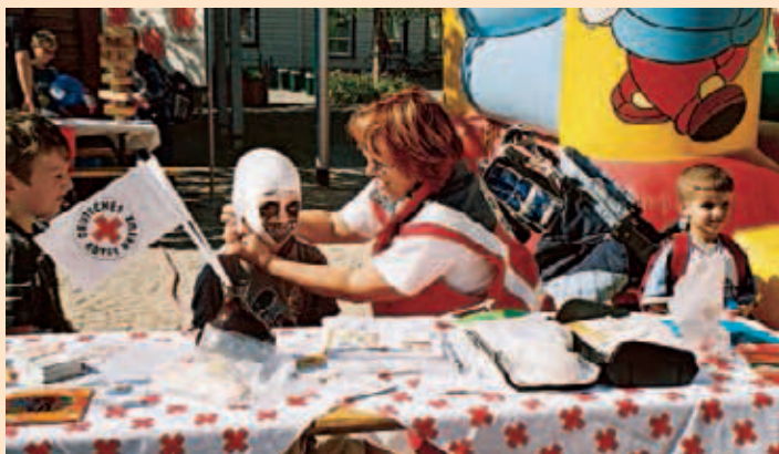
▲ Am DRK-Stand konnte man sich schminken und verarzten lassen