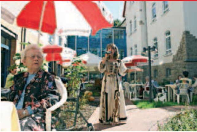
▲ Traditionelles Sommerfest im Seniorencentrum Goldene Aue