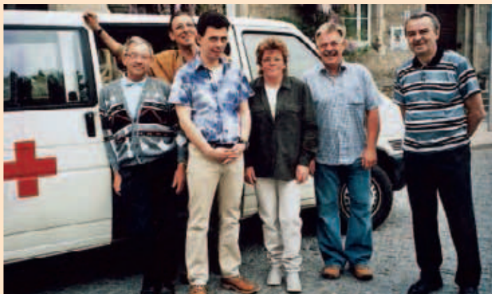
▲ Das Team der Weißenfelser Sucht- und Drogenberatung

Hier setzt die Suchtberatung im Kreisverband Weißenfels an. Vier wichtige Grundsätze liegen der täglichen Arbeit zugrunde: