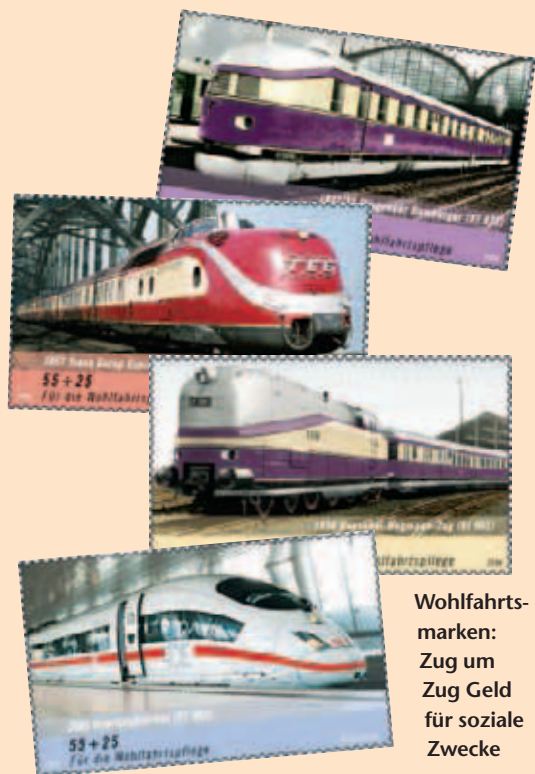
Wohlfahrtsmarken: Zug um Zug Geld für soziale Zwecke