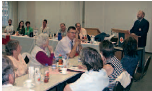
▲ Reges Interesse zeigten die Besucher der Kreisversammlung

2005 hatte der Kreisverband 2746 Mitglieder; im Rettungsdienst wurden bei 6147 Einsätzen 145 925 Kilometer gefahren; die Mitarbeiterinnen der Sozialstation fuhren bei 22 348 Hausbesuchen 113 512 km. Im Einzugsbereich des Kreisverbandes wurden 52 Blutspendetermine durchgeführt, zu denen 2768 Spender erschienen. Besonderer Dank gilt den aktiven ehren- und hauptamtlichen Mitgliedern, die im Katastrophenschutz, im Jugendrotkreuz und in den Seniorengymnastikgruppen mitwirken.