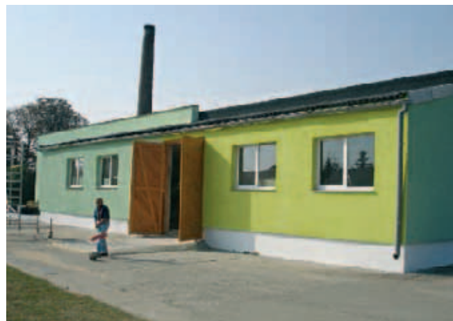
▲ Mit eigener Arbeit geschaffen. Neu saniertes Gebäude auf dem Gelände der Suchtkurve