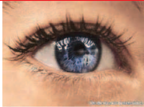
◀ Mit welchem Blick ist Kinderarmut in Deutschland nicht zu übersehen