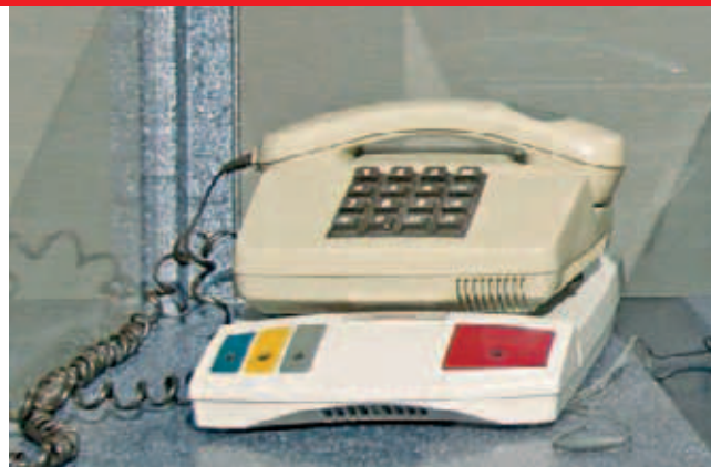
▲ Telefon mit Notrufgerät: mehr Sicherheit und Selbstständigkeit