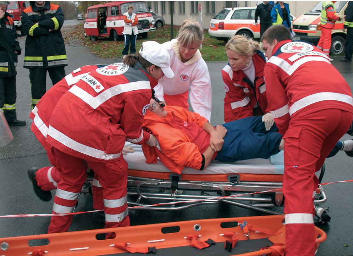
Arbeit im Team: Nur so sind die Anforderungen zu bewältigen

Ein Unfallszenario stellte die gute Zusammenarbeit der Rettungskräfte unter Beweis.