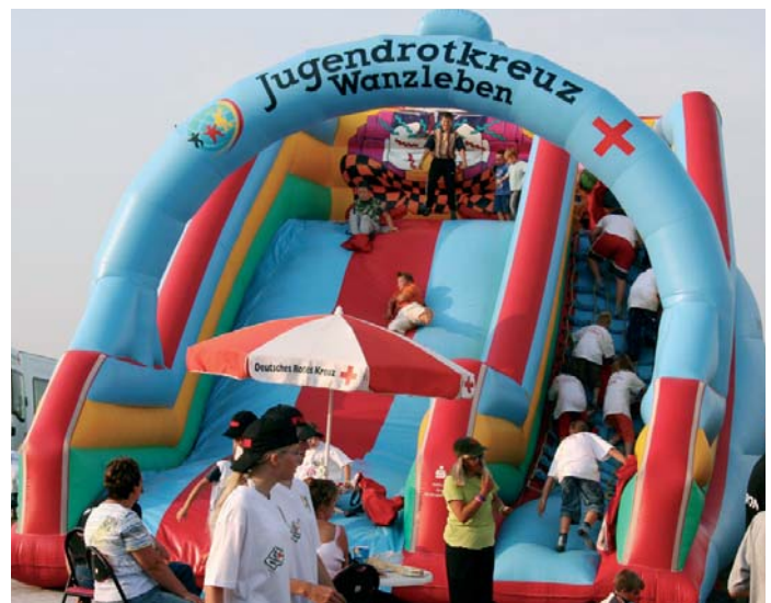
Riesig: Die 7,5m große Rutsche des Jugendrotkreuzes Wanzleben