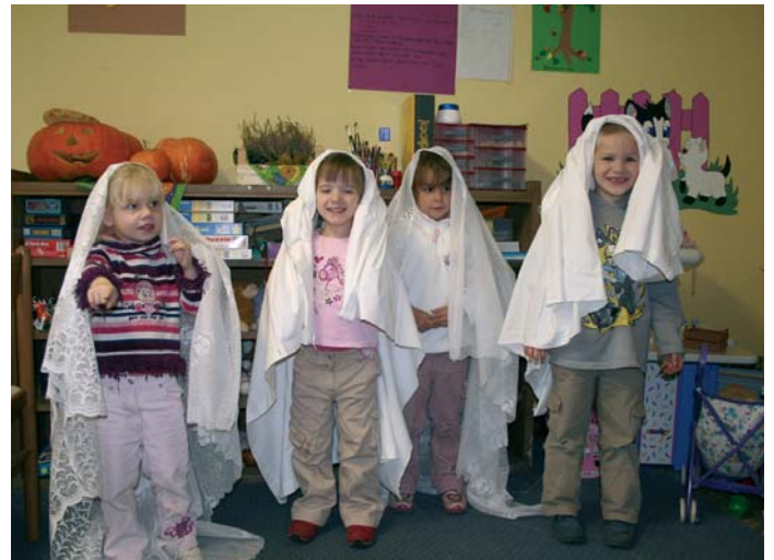
Kleine Geister: Halloween im Tagesaufenthaltszentrum