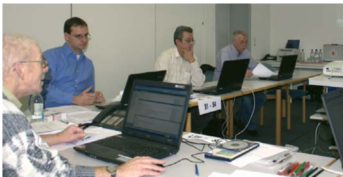
Hochbetrieb: Im Einsatz- und Lagezentrum des Landesverbandes

Am 7. und 8. November fand in Deutschland eine der größten Katastrophenschutzübungen der Nachkriegszeit statt: die länderübergreifende Krisenmanagementübung LÜKEX. In deren Rahmen war auch das Einsatz- und Lagezentrum für Katastrophenfälle (ELZ) des DRK-Landesverbandes an beiden Tagen im Einsatz. In einem fiktiven Katastrophenfall kam es zu einer weltweiten Grippe-Epidemie; allein in Deutschland mussten mehrere hunderttausend Personen medizinisch versorgt oder betreut werden. Alle Reaktionen und Hilfeleistungen gegenüber den Bundes- und Landesbehörden, dem DRK-Bundesverband und den Mitgliedsverbänden erfolgten über das ELZ. Auch sämtliche Anforderungen und Anweisungen gegenüber den Kreisverbänden erfolgen seitens des Einsatzstabes in der Landesgeschäftsstelle. Nach der erfolgreichen Beendigung der Übung kann eine positive Bilanz aus der Arbeit des ELZ gezogen werden. Das schnelle und koordinierte Handeln aller Beteiligten trägt im Ernstfall entscheidend zum Schutz der Bevölkerung bei.