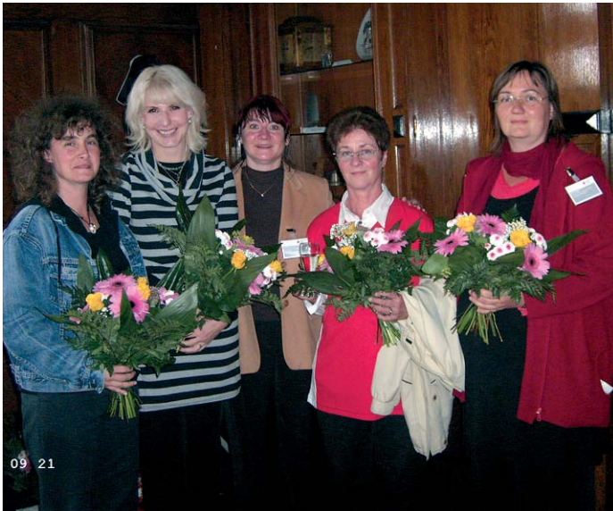
Alzheimer Tag in Halle: Das Team des Modellvorhaben „Türen öffnen“