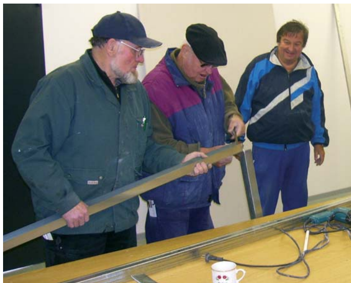
Gestaltung: Die Mitglieder des Ortsvereins bei der Arbeit

Es bestand der Wunsch die Kleiderkammer mit einer Umkleidekabine zu versehen und die Tafelmitarbeiter brachten den Vorschlag ein, den Raum der Lebensmittelausgabe so umzugestalten, dass zwischen Ausgabe und Lagerraum eine Trennwand eingebaut wird, um die