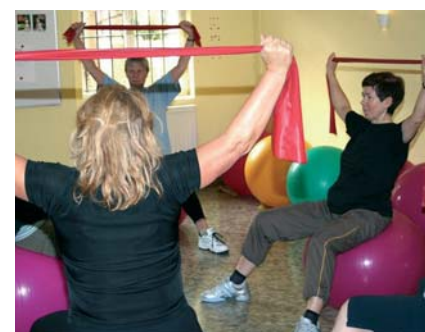
Unsere Sportgruppe: bei den Übungen mit dem Theraband