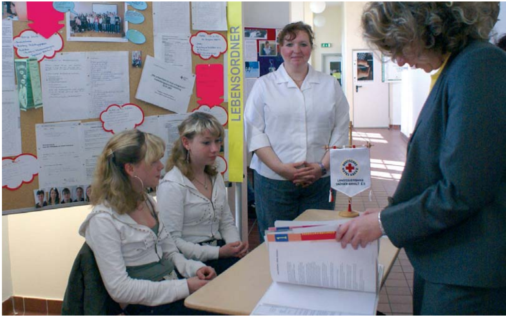
Aufklärung: Vorstellung des Berufswahlpasses von Schülern und freiwilligen Betreuern in Halle

Mit dieser Frage beschäftigt sich ein Projekt, in dem Erwachsene Jugendlichen bei der Berufsorientierung helfen.