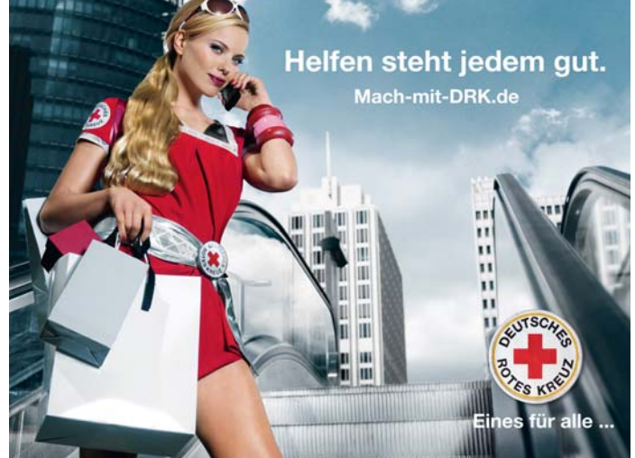
Das „It-Girl“: Eines der vier neuen Motive

Das Wellnesswochenende geht in dieser Ausgabe nach Schweinitz/Elster, der 2. Preis nach Völpke und der 3. Preis an einen Gewinner aus Walbeck. Herzlichen Glückwunsch! Wir danken für die Zuschriften. Wir freuen uns auch über Leserbriefe mit Ihrer Meinung, besonders auch zum neuen Heft.