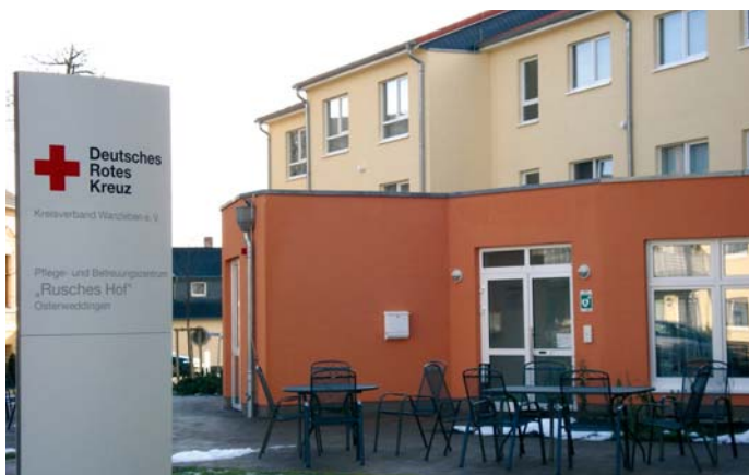
Wegweisend: Eingang des DRK Pflegeheims