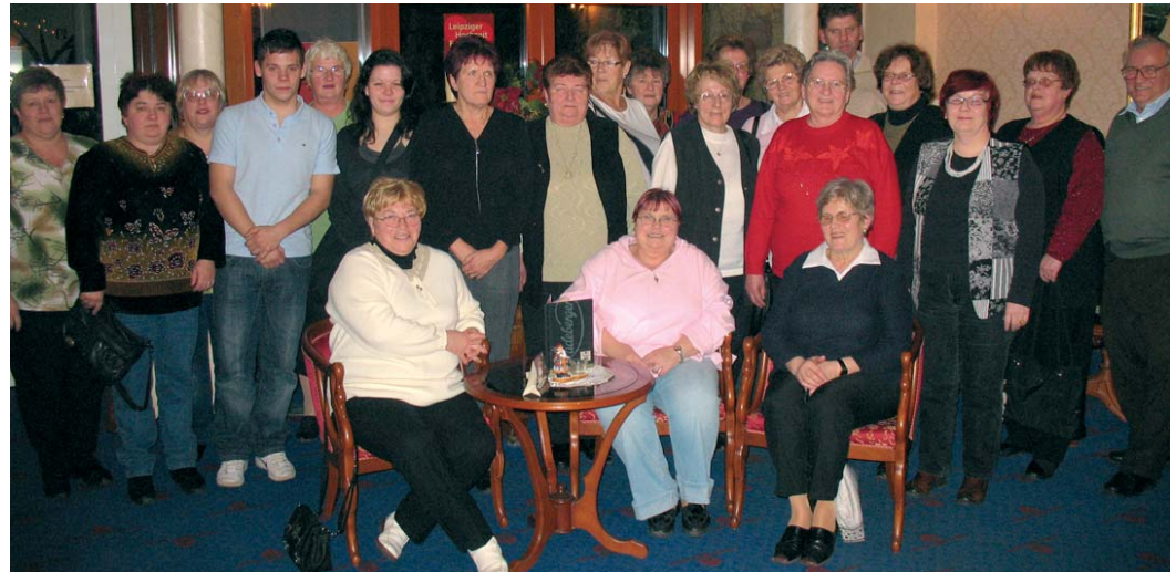
Dankeschön: Gruppenbild der Geehrten

Stunden vor Terminbeginn müssen die Räumlichkeiten so hergerichtet werden, dass das Blutspendeteam schnell die Liegen für die Spender aufstellen kann. Es müssen Tische geschoben, Stühle verrückt werden, damit es auch die Blutspender etwas gemütlich haben. Außerdem werden Tische gedeckt, Kaffee gekocht und Tee aufgebrüht. Mit Liebe zum Detail wird der Imbiss angerichtet. Zusätzlich erfüllen unsere Helfer oftmals Wünsche unserer Blutspender, denn jeder soll für seine Spende auch „entlohnt“ werden. Zu vielen aktiven