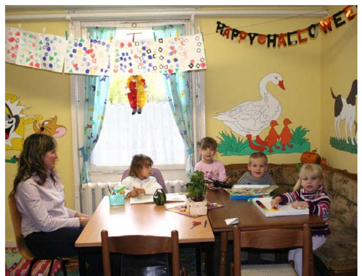
Spielen und basteln: für die Kinder das Größte