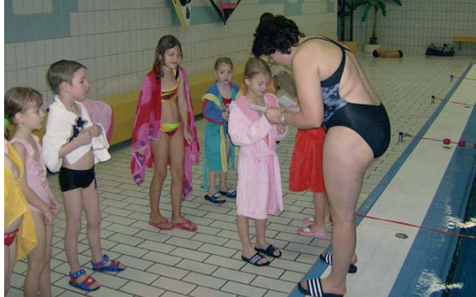
Stolz: Das Seepferdchen für die jungen Schwimmer