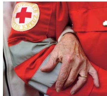
Das Titelfoto ist eine Arbeit von Andrea Rostel und eine der vielen hervorragenden Einsendungen zu unserem Fotowettbewerb. Mehr dazu im Heft.