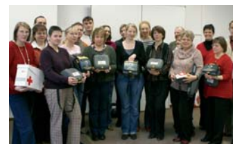
Übergabe der Geräte: die Vertreter der Kreisverbände

Gegenüber einer Herz - Lungen - Wiederbelebung erhöhen die Elektroschocks mittels solcher Defibrillatoren die Überlebenschancen bei einem plötzlichen Herztod um bis zu 50 Prozent. Das plötzliche Herzversagen zählt zu den häufigsten Todesursachen. Weitere Informationen zu dem Thema –Lebensretter AED- erhalten Sie bei jedem Kreisverband des Deutschen Roten Kreuzes in Sachsen-Anhalt oder unter www.sachsen-anhalt.drk.de