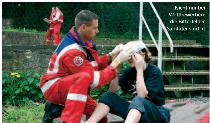
Nicht nur bei Wettbewerben: die Bitterfelder Sanitäter sind fit