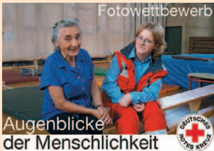
▲ Machen Sie „Ihr“ Bild vom Roten Kreuz und gewinnen Sie mit!

■ Der DRK-Landesverband Sachsen-Anhalt ruft zum Fotowettbewerb auf. Die Motive können so vielfältig sein wie die Arbeit des DRK: Helfer des DRK im Einsatz für den Katastrophenschutz, in den Rettungsdiensten, in den Gemeinschaften, das soziale Engagement des DRK etwa in Altenpflege und Jugendarbeit oder öffentliche Veranstaltungen des Roten Kreuzes – Hauptsache das Rotkreuzthema „Menschlichkeit“ kommt zum Ausdruck. Auch Symbolfotos oder Fotomontagen können eingereicht werden. Mitmachen kann jeder der Interesse und Spaß am Fotografieren hat. Einsendeschluss ist der 8.11.2007. Eine Jury entscheidet über die besten Aufnahmen. Die schönsten Fotografien werden auf der Homepage und in der Mitgliederzeitung des Roten Kreuzes sowie in anderen Medien veröffentlicht. Auch Preise gibt es zu gewinnen. Mehr Informationen unter www.sachsen-anhalt.drk.de