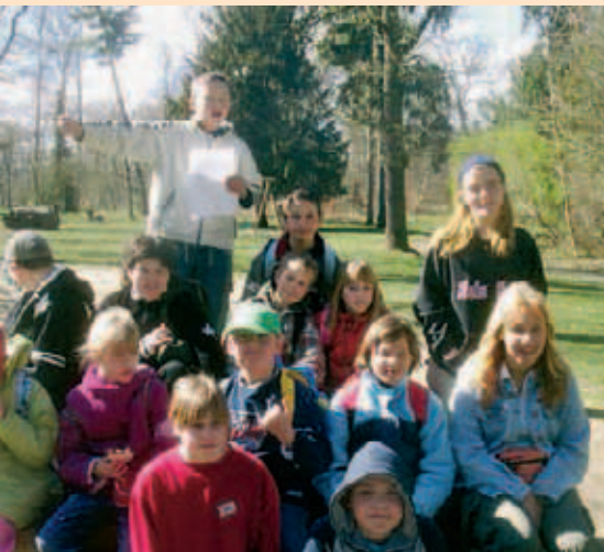
▲ Osterferien auch mit wenig Geld konnten Quedlinburger Kinder dank dem DRK genießen

■ QUEDLINBURG JRK-Ferienaktion. Das Jugendrotkreuz hat in der Woche vom 2.-6. April, täglich in der Zeit von 9.30 Uhr bis 15.30 Uhr, kostenlos eine Ferienveranstaltung durchgeführt. Diese Aktion richtete sich an 20 Kinder im Alter von 8 bis 10 Jahren aus den Lernbehinderten-Schulen Pestalozzischule in Quedlinburg und Schule am Reißbus in Bad Suderode.