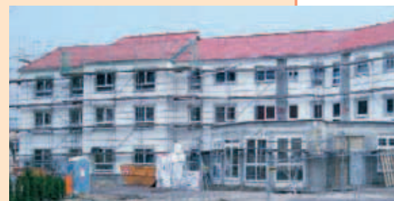
▲ Noch mit Gerüst, aber bald plangemäß fertig: das neue Seniorenzentrum