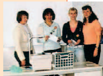
◀ Beim Erste-Hilfe-Kurs gewinnt man immer – manchmal auf überraschende Weise