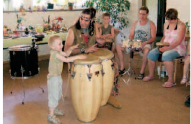
▲ ELAN: Mit Spaß lernen und dadurch eine Familie werden