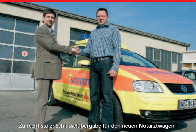
Zu recht stolz: Schlüsselübergabe für den neuen Notarztwagen