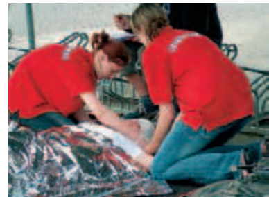
▲ 700 Kinder stehen für Notfälle an Schulen bereit

■ Vom 29.6. bis 1.7. findet in Wolmirstedt der 11. Schulsanitätätag in Sachsen-Anhalt statt. Die 700 in Erster Hilfe ausgebildeten Schulsanitäter an 60 Schulen in Sachsen-Anhalt übernehmen selbstbewusst Verantwortung, erwerben soziale Kompetenz, erhöhen die Sicherheit an der Schule bei kleinen Unfällen im Pausendienst, an Wandertagen oder bei Sportfesten und tragen somit auch zur Verbesserung des Schulklimas bei. Weitere Infos unter: 03 45/500 85 38 oder www.sachsen-anhalt.drk.de .