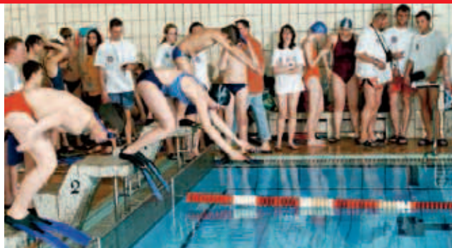
▲ Rund ums Wasser hilfsbereit: Die Wasserwacht im DRK

Ein besonderes Highlight steht am 16. Juni ins Haus. Unser Landesverband wird Gastgeber der 32. Deutschen Mei-