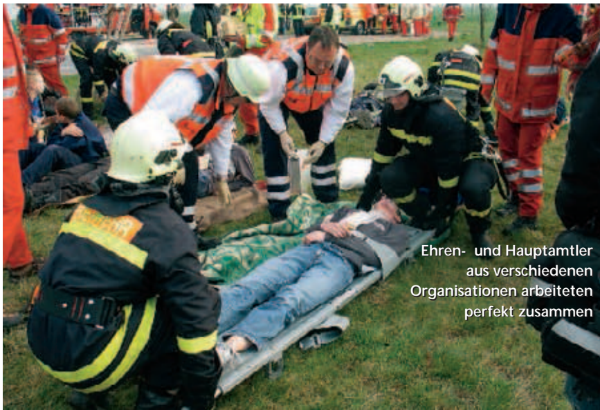
Ehren- und Hauptamtler aus verschiedenen Organisationen arbeiteten perfekt zusammen