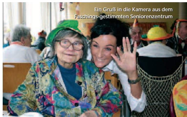
Ein Gruß in die Kamera aus dem Faschings-gestimmten Seniorenzentrum