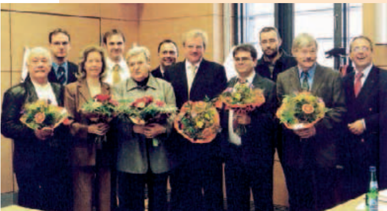
▲ Aktiv für Sachsen-Anhalt: das erweiterte Präsidium