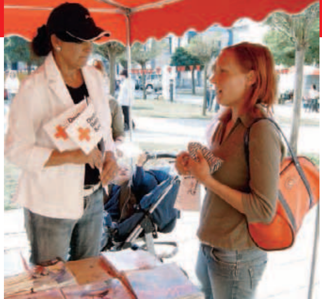
▲ Auch Informationsstände dienen der Gesundheitsvorsorge