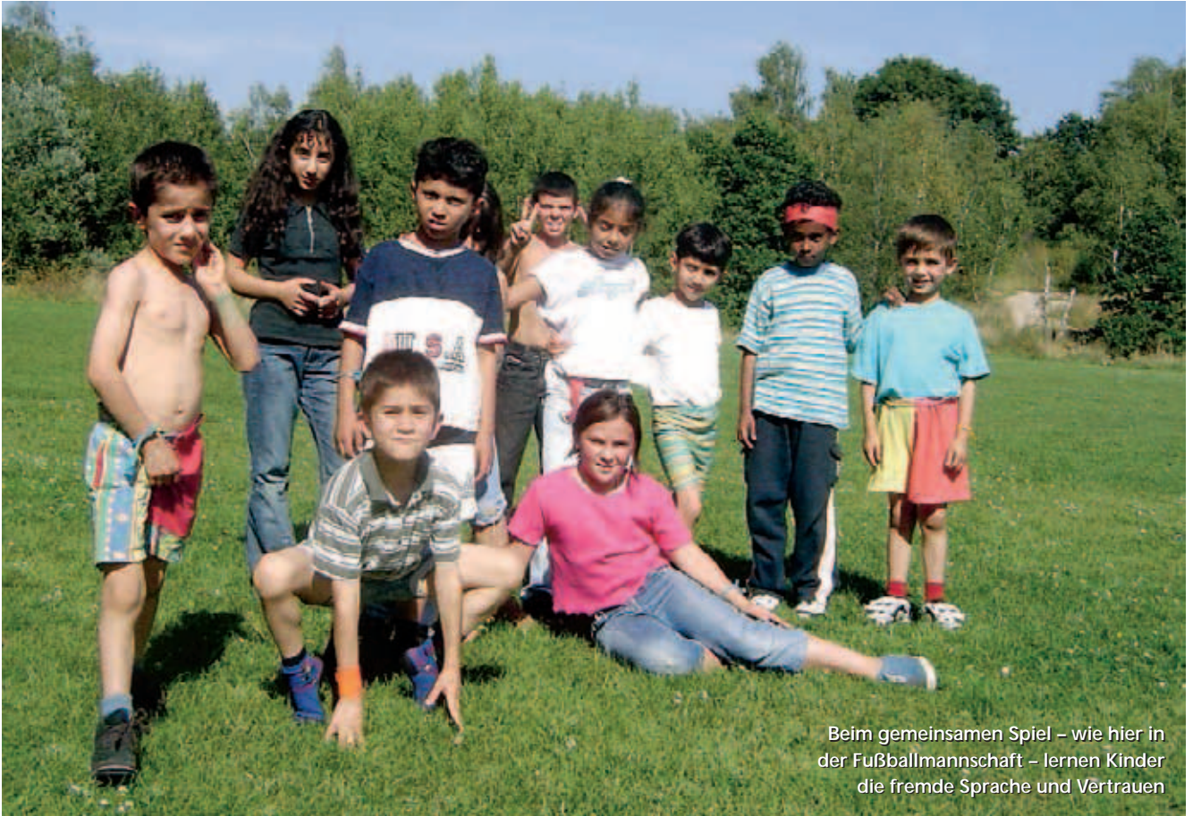
Beim gemeinsamen Spiel – wie hier in der Fußballmannschaft – lernen Kinder die fremde Sprache und Vertrauen

Integration umfasst ein weites Feld. Um dieses fruchtbar zu machen, müssen alle mit anfangen. Der Bereich Migration des DRK-Kreisverbandes Halle-Saalkreis-Mansfelder Land erreicht das durch die Vernetzung vielseitiger Angebote und die Nutzung der Ressourcen im Verband.