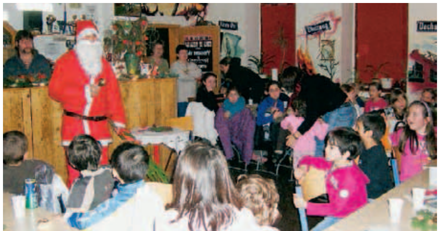
▲ Bei der DRK-Weihnachtsfeier in der Jugend- und Seniorenbegegnungsstätte „Zeche“ sangen große und kleine Gäste gemeinsam Lieder in vielen Sprachen

nachtsmann und seinem Wichtel musste hier keiner Angst haben, denn man konnte mit ihm schöne Späße treiben, Lieder und Gedichte in deutscher, russischer oder kurdischer Sprache vortragen und ihm auch eine kleine Überraschung aus dem Geschenkesack entlocken. Ein Höhepunkt des Abends war die Feuer- und Jongliershow auf dem Hof. Kathi Berger