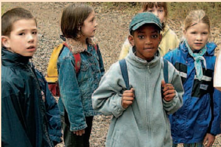
▲ Nicht nur für Kinder mit Migrationshintergrund, auch für „Einheimische“, bedeutet ein Wanderausflug, fremde Welten zu erkunden