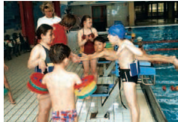
▲ In einem fremden Land heimisch werden ist fast wie schwimmen lernen