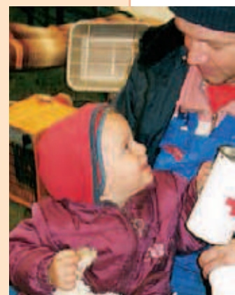
▲ Ein Mitglied des Betreuungszuges im Einsatz bei den kleinen Gästen