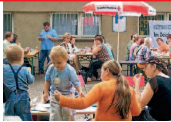
▲ Bei Begegnungstagen können sich Menschen und Kulturen kennen lernen