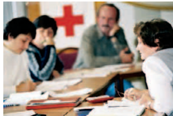
▲ Auch Eltern müssen mal die Schulbank drücken: Deutschkurs für Migranten