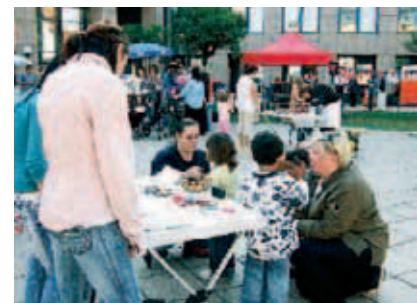
► Viele Kinder mit ihren Eltern kamen zu den Aktionstagen