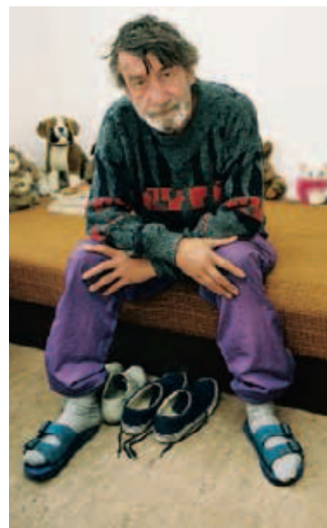
◀ Nicht nur an Migranten richtet sich die Integrationsarbeit des DRK, auch an Arme, Obdachlose und Behinderte