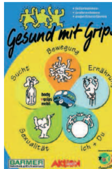
▲ Das Body+Grips-Mobil bringt Gesundheitsaufklärung mit Spaß und Pfiff

Neben dem bekannten Parcours „Eine Reise durch den Körper“ für die Grundschulen (Klasse 3 und 4) gibt es nun den neuen „Gesund mit Grips“-Parcours für die Sekundarstufe mit 15 neuen Stationen aus den Themenbereichen Bewegung, Ernährung, Ich & Du, Sexualität und Sucht. Eine Fragebogen-Aktion komplettiert den Body+Grips-Mobil-Einsatz für die Sekundarstufe. Sie verdeutlicht die aktuelle Selbsteinschätzung der eigenen Gesundheit der Teilnehmerinnen und Teilnehmer und ihre Neugier auf weitere Informationen. Kernzielgruppe des neuen Body+Grips-Mobil sind Jugendliche im Alter von elf bis 16 Jahren.