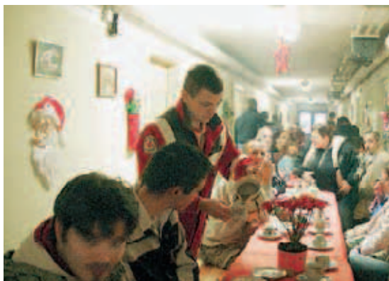
▲ Eng, aber herzlich ging es zu bei der Weihnachtsfeier in den Räumen der Oscherslebener Tafel

für Interessenvertreter, die sich für Familien besonders mit sozial schwachem Umfeld einsetzen. Zu diesen Netzwerkpartnern zählt die Oscherslebener Tafel, die im Jahre 2000 vom Kreisverband Oschersleben ins Leben gerufen wurde. Seit Anfang 2003 gehört die Suppenküche zum Bundesverband der Tafeln in Deutschland. Seither ist sie unter dem Namen „Oscherslebener Tafel“ bekannt.