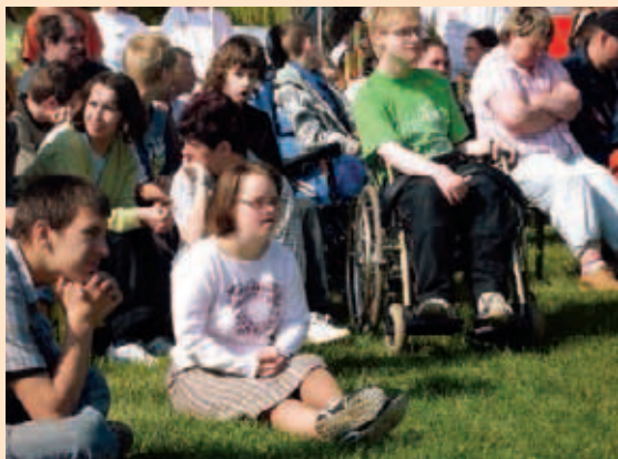
◀ Diese jungen Menschen mit Behinderung sollen in ihrem Leben möglichst viel Eigenverantwortung ausleben können

■ Chancengleichheit ist für Menschen mit Behinderung wesentlich. In ihrer Umwelt fehlt es oft an materiellen Voraussetzungen, Akzeptanz, Verständnis, Vertrauen und Interesse – bis hin zur Ignoranz. Selbst im etablierten System der Behindertenhilfe werden sie oft nicht als eigenständige und verantwortliche Personen ernst genommen. Das könnte sich ändern durch die gesetzliche Möglichkeit, Leistungen im Rahmen eines „Persönlichen Budgets“ selbst auszuwählen und „einzukaufen“. Bei diesem Modell bewilligt der Kostenträger nicht mehr eine Komplexleistung, sondern stellt einen Geldbetrag zur Verfügung, mit dem die nötigen individuellen Leistungen bezahlt werden können. Damit werden Menschen mit Behinderung besser selbst bestimmen können, welche Leistungen in welchem Umfang und zu welcher Zeit sie in Anspruch nehmen wollen. Vom passiven Leistungsempfänger werden sie zum aktiven Kunden, der mit seiner Nachfrage das Angebot beeinflusst. Die Möglichkeit, über sein Leben selbst zu bestimmen, bedeutet ein Leben auf gleicher Augenhöhe mit den anderen Mitgliedern unserer Gesellschaft und ist damit auch eine grundlegende Voraussetzung für Chancengleichheit.