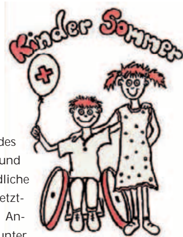
▲ Viel Spaß für Kinder und Jugendliche verspricht der Kindersommer

■ Der 18. integrative Kindersommer des Jugendrotkreuzes für behinderte und nichtbehinderte Kinder und Jugendliche wird vom 21.7.-3.8. und vom 5.-18.8. letztmalig in der JH Nebra durchgeführt. Anmeldungen sind ab dem 1.3. möglich unter 03 45/50 08 538. Informieren Sie sich beim Jugendrotkreuz unter www.sachsen-anhalt.drk.de/