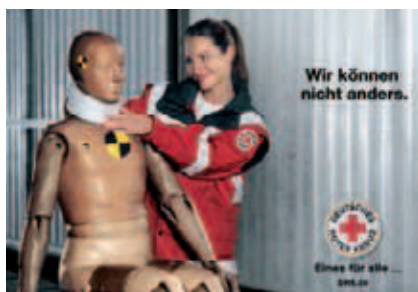
▲ Helfen steckt DRKlern einfach im Blut

■ Die Imagekampagne des Roten Kreuzes geht weiter – in diesem Jahr mit dem Grundsatz „Menschlichkeit“, der eine zentrale Motivation der DRK-Aktiven und -Mitarbeiter ist. Diese Einstellung spiegelt sich im Bekenntnis: „Wir können nicht anders“, das die sympathisch-humervollen Motive kommentiert.