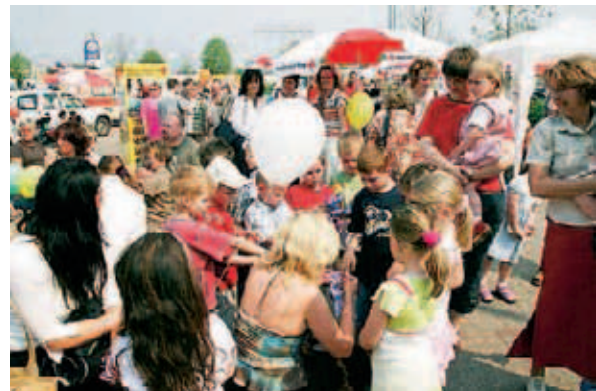
▲ Bei öffentlichen Veranstaltungen wie hinter den Kulissen waren die Rotkreuzler im Einsatz

ihre Arbeit zum Gemeinwohl aus. Mit ihnen kann das Rote Kreuz voller Zuversicht in eine erfolgreiche Zukunft blicken. Rüdiger Wagner