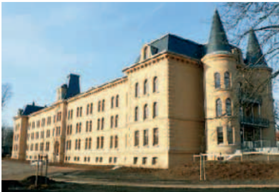
▲ Außen edel, innen komfortabel: das neue Haus 2 des Altenpflegeheims Annaburg in Wittenberg