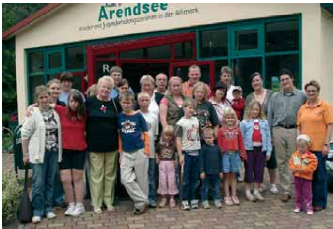
▲ Den klugen Umgang mit knappem Geld lernten diese neun Familien durch ELAN

■ WANZLEBEN/WORMSDORF: Familienbildung. Neun Familien mit 26 Mitgliedern kamen zum Angebot „Leben in Zeiten knapper Kassen“ im Bildungsprogramm ELAN des Kreisverbandes Wanzleben. Es begann mit einem Wochenende im KIEZ (Kinder- und Jugenderholungszentrum) Arendsee. In verschiedenen Workshops zum Thema Geld bekamen Erwachsene und Kinder wertvolle Hinweise zum Umgang mit Geld, zu vermeintlichen Schnäppchen und Kostenfallen und dazu, wie Werbung Wünsche und Bedürfnisse beeinflusst. In Nachtreffen in der DRK-Begegnungsstätte Wormsdorf lernten die Teilnehmer eine gesund-