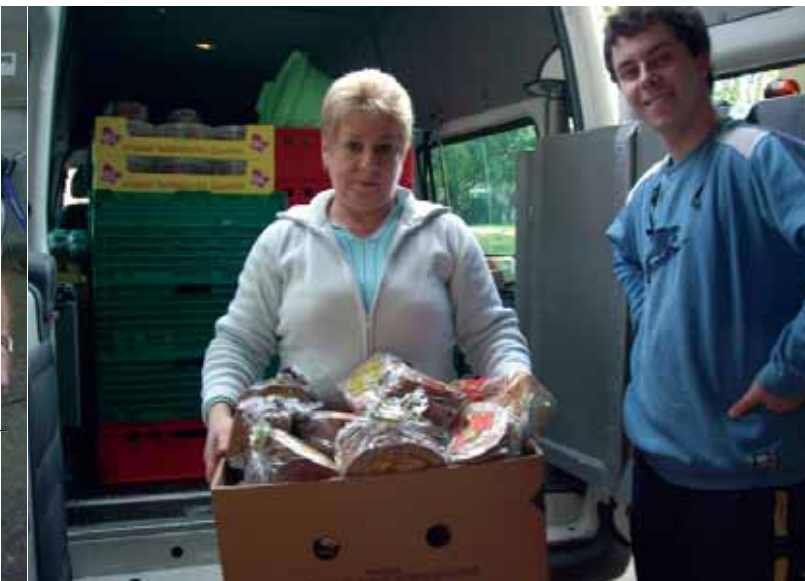
▲ Alle helfen beim Ausladen, wenn die Spenden kommen. Die Tafelmitarbeiter sind Ein-Euro-Jobber, die so anderen Menschen in Notlagen helfen können

Jeden Tag ist die Wundertüte ein bisschen anders zusammengesetzt, je nachdem was die Spendepartner abzugeben hatten. „Heute haben wir