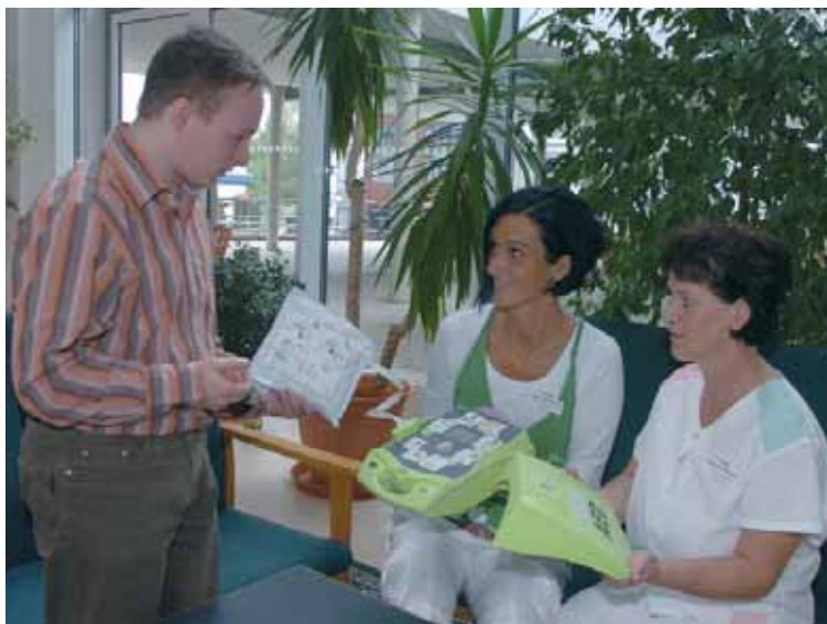
▲ Automatische Externe Defibrillatoren sind Lebensretter beim plötzlichen Herztod. In zwei Seniorenzentren sind jetzt solche Geräte installiert, die Helfer wurden geschult

Bei 40-50 Prozent der Betroffenen wird beim plötzlichen Herztod ein Kreislaufstillstand durch ein Kammerflimmern ausgelöst. Die Erste-Hilfe-Lehrmeinung fordert in einem solchen Fall die sofortige Herz-Lungen-Wiederbelebung wegen akuter Lebensgefahr. Die beste, ja nahezu einzig wirksame Behandlung des Kammerflimmerns ist aber die sofortige elektrische Defibrillation. Sie bietet Überlebenschancen bis zu 50 Prozent, das heißt mit schneller Frühdefibrillation und Herz-Lungen-Wiederbelebung kann je-