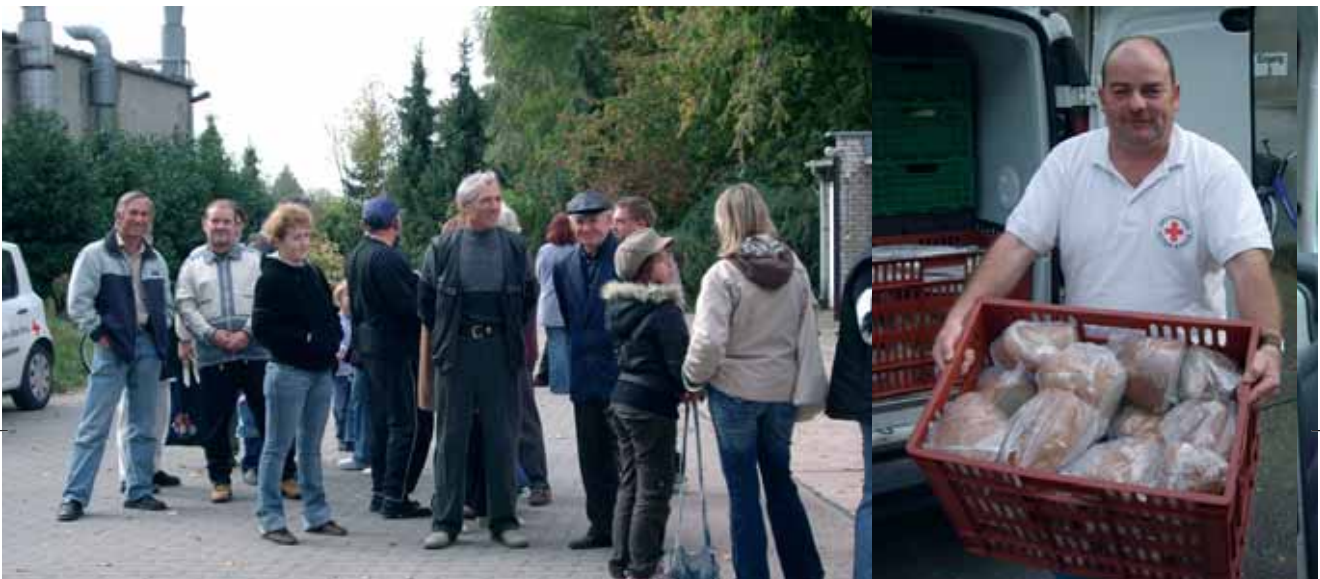
▲ Schon lange vor der offiziellen Ausgabezeit um 15 Uhr stehen die Wartenden Schlange. Die Tafel ist auch ein Treffpunkt zum Kennenlernen und Ratschen

Seit knapp einem Jahr betreibt das Rote Kreuz im ehemaligen Ohrekreis zwei Tafeln. Die gespendeten Lebensmittel helfen vielen Menschen zu einem gesünderen und ausgeglicheneren Speisezettel.