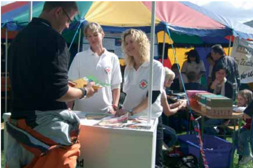
▲ 15 000 Familien informierten sich auch über Angebote des DRK-Kindertagesstätten