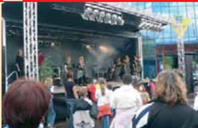
▲ Bühnenshow zum Weltrotkreuztag 2007