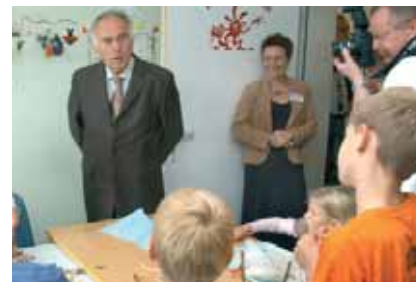
▲ Ergiebiger Austausch mit Ministerpräsident Böhmer

Mit ihrer angebotsorientierten Vermarktung und dem Programm „Gesundheit aktivieren“ ( www.gesundheit-aktivieren.de ) sei die Klinik auf dem richtigen Weg, sich dem Wettbewerb mit älteren und bekannteren Kurstädten zu stellen, resümierte Böhmer seinen ersten Besuch des Hauses.