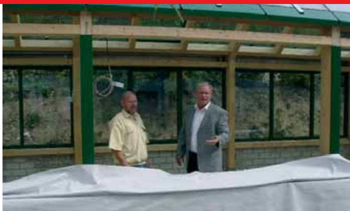
▲ Regensicher frische Luft schöpfen kann man im neuen Laubengang in Hecklingen