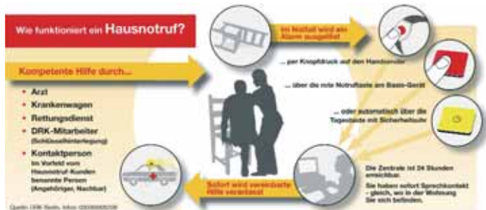
▲ Jederzeit Sicherheit durch direkte Verbindung zum Rettungsdienst – der Hausnotruf

Derzeit werden mehr als 6700 Teilnehmer in Sachsen und Sachsen-Anhalt betreut – und immer mehr möchten diese Hilfe nutzen. Das DRK bietet seinen Fördermitgliedern Sonderkonditionen an. Weitere Details und Informationen zum Service Hausnotruf erhalten Sie unter der Tel. 01 80/36 50 180 (9 Cent/Minute) oder im Internet unter www.hnr.de .