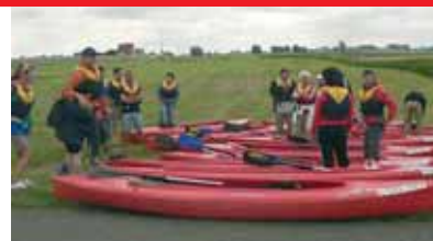
▲ Alle Boote sind bereit zum Start

Es war im wahrsten Sinne des Wortes ein feucht-fröhliches Vergnügen, denn auch ein auftretendes Gewitter mit Regengüssen konnte das Unternehmen nicht stoppen – schließlich wurde für den Notfall so manch schnell