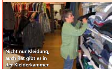
Nicht nur Kleidung, auch Rat gibt es in der Kleiderkammer