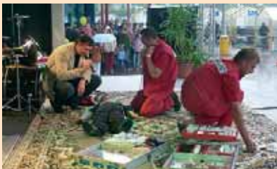
▼ Erste-Hilfe-Demonstration auf der Bühne

Natürlich war die gelungene Präsentation des DRK Wittenberg nur möglich dank vieler fleißiger Hände von Wasserwacht, Betreuungszug, Sanitätszug, Jugendrotkreuz, Blutspende und Rettungsdienst – und dank der Unterstützung durch die Sponsoren EDEKA-Center, Medi-Max, Bau-Depot im Carat-Park und Automobile GmbH in Jessen.