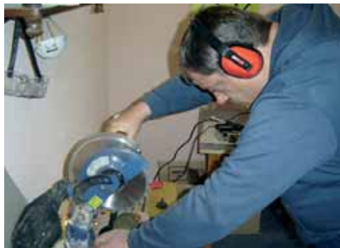
▲ Auch eine Holzwerkstatt gehört zum Angebot

Nicht alle Menschen haben ihr „täglich Brot“, obwohl es Lebensmittel im Überfluss gibt. Für eine Lebensmittelausgabe stellte die Stadt Wanzleben dem DRK-Kreisverband eine Wohnung in der Windmühlenbreite Nr. 30 zur Verfügung. Qualitativ einwandfreie Nahrungsmittel, die nicht mehr verkauft werden können, sollen hier an Menschen in Not verteilt werden. Weitere Informationen erhalten sie unter Tel.: 03 92 09 / 63 90. Cynthia Brand