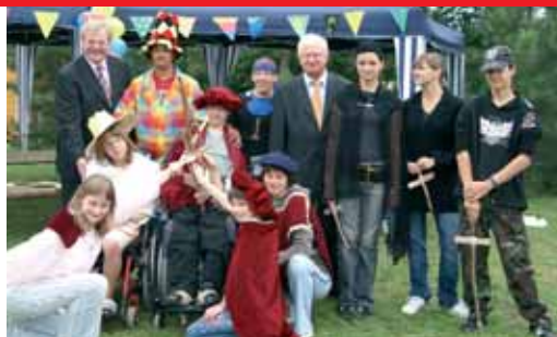
▲ Der DRK-Präsident zwischen den verkleideten Jugendlichen

Die seit 1990 vom DRK-Landesverband Sachsen-Anhalt veranstaltete integrative Ferienfreizeit ist bundesweit beispielhaft. Von den 60 Teilnehmern von sechs bis 16 Jahren kann die Hälfte behindert sein. Auch für 10 Rollstuhlfahrer hat der KinderSommer Kapazitäten, die Betreuung leisten rund 20 Jugendliche rein ehrenamtlich. Der günstige Preis, etwa 250 Euro für zwei Wochen, wird durch Unterstützung der Lotto-Toto GmbH ermöglicht. Schon mehr als 3000 Kinder und Jugendliche haben ihre Ferien im KinderSommer verbracht. Unterstützt wurde der KinderSommer bisher von 900 Betreuern. Seit elf Jahren sind das ausschließlich ehrenamtlich