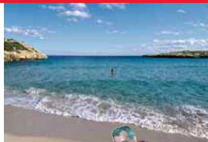
► Attraktiver Kursort: Sogar auf Mallorca hat das DRK einen Erste-Hilfe-Kurs geboten