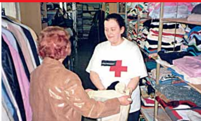
▲ Abgelegte Kleider können in der Kleiderkammer noch vielen Menschen helfen