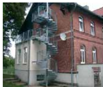
▲ Die Feuertrappe ist nur eine von vielen Baumaßnahmen für mehr Sicherheit

■ QUEDLINBURG/HALBERSTADT: Spürbare Veränderungen im Kinderheim Anderbeck. Seit 1992 trägt das DRK Quedlinburg/Halberstadt das DRK-Landkinderheim „Am Huy“ in Anderbeck. In den letzten Jahren wurden in einer Rundum-Kur die Lebensqualität für die Kinder und Jugendlichen und die Arbeitsbedingungen für die Mitarbeiter verbessert. Aus den früheren 6- und 4-Bettzimmern wurden überwiegend behagliche Einbettzimmer. Jede Gruppe hat eine eigene