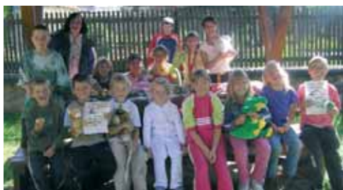
▲ Vor allem Kinder aus armen Familien brauchen gute Betreuungsangebote

■ HALLE-SAALKREIS-MANSFELDER LAND: Persönlichkeitsentwicklung fördern. Der Landkreis Mansfeld Südharz belegt mit 20,6 % Arbeitslosigkeit bundesweit einen Spitzenplatz. Im Alt-kreis Mansfelder Land lebten im Mai 2007 rund 13 900 Bedarfsgemeinschaften von Arbeitslosengeld II – darunter