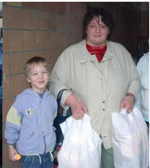
▲ Prall gepackt sind die Tüten mit den gespendeten Lebensmitteln für einen Euro

Lebensmittel nach ihrem Verbrauchsdatum zu sortieren. Das Gemüse wird nochmal geputzt. Schließlich sollen nur einwandfreie Lebensmittel über den Ladentisch gehen. Dann werden die Beutel gepackt. Rund 120 sind es heute. Auch einige Großfamilien sind angemeldet – und jeder soll bedient werden.