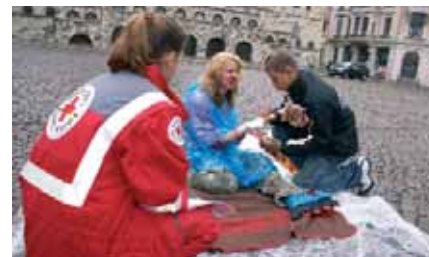
▲ Zum Glück nur gestellt: Erste Hilfe beim Wettbewerb auf dem Hallemarkt

Das Szenario am 8. September auf dem halleschen Hallemarkt war glücklicherweise nur eine Übung. Am Internationalen Tag der Ersten Hilfe trafen sich 24 Mannschaften des Jugendrot-