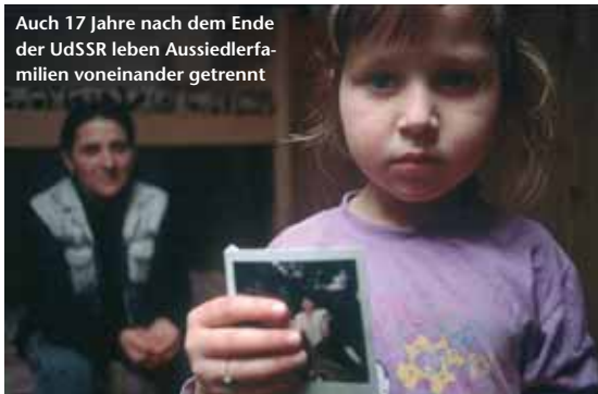
Auch 17 Jahre nach dem Ende der UdSSR leben Aussiedlerfamilien voneinander getrennt

möchten. Noch immer gibt es in Deutschland 1,3 Millionen ungeklärte Fälle, in denen Familien bisher nichts über das Schicksal ihrer Vermissten wissen oder herausfinden können. Jedes Jahr gehen beim Suchdienst bis zu 2000 neue Anfragen im Zusammenhang mit dem Zweiten Weltkrieg ein.